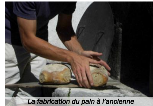
La fabrication du pain à l'ancienne

Confection d'un pain et cuisson dans le four de l'Écomusée. Atelier thématique « Le chemin du blé » et animation « Jeux bretons » pendant la cuisson du pain.