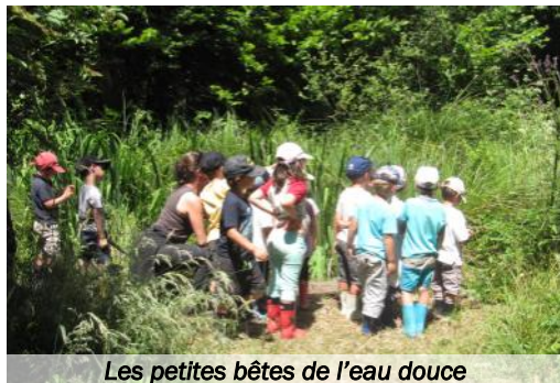
Les petites bêtes de l'eau douce