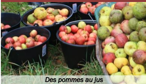
Des pommes au jus