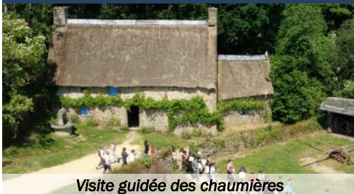
Visite guidée des chaumières