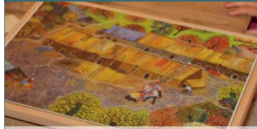
La mémoire des champs - L. Pouedras